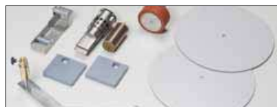
Item No. 1091P2 Kit za zavarivanje trake 50 mm za FORSTHOFF-P2