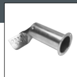
Item No. 1117P2 Dizna za preklop 45 mm