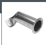
Item No. 1116P2 Dizna za preklop 20 mm