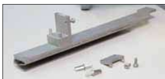
Item No. 1113P2 Dodatak za porube 20 mm ili 30 mm